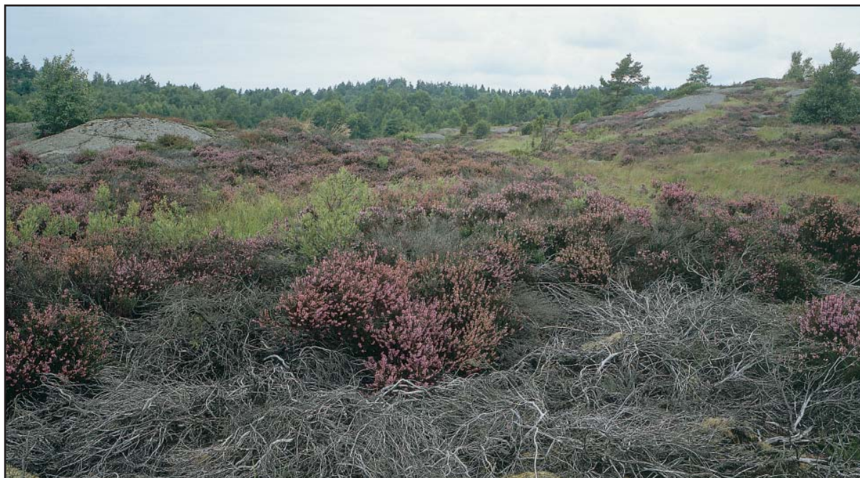
Sandsjöbacka öster om Kringlevatten

Vidsträckta hedar har under 5000 år formats av människor genom odling, brand och betesdjur. Vid 1800-talets slut fanns ännu 500.000 hektar ljunghed i Sverige men 100 år senare återstod mindre än 2500 hektar! Många arter som förr levde på ljunghedarna är idag nästan försvunna. Genom att bevara och utöka arealen traditionellt skött ljunghed kan dessa arter åter ges nytt livsrum. Samtidigt bevaras ett landskap som bär spår av människans äldsta jordbruk.