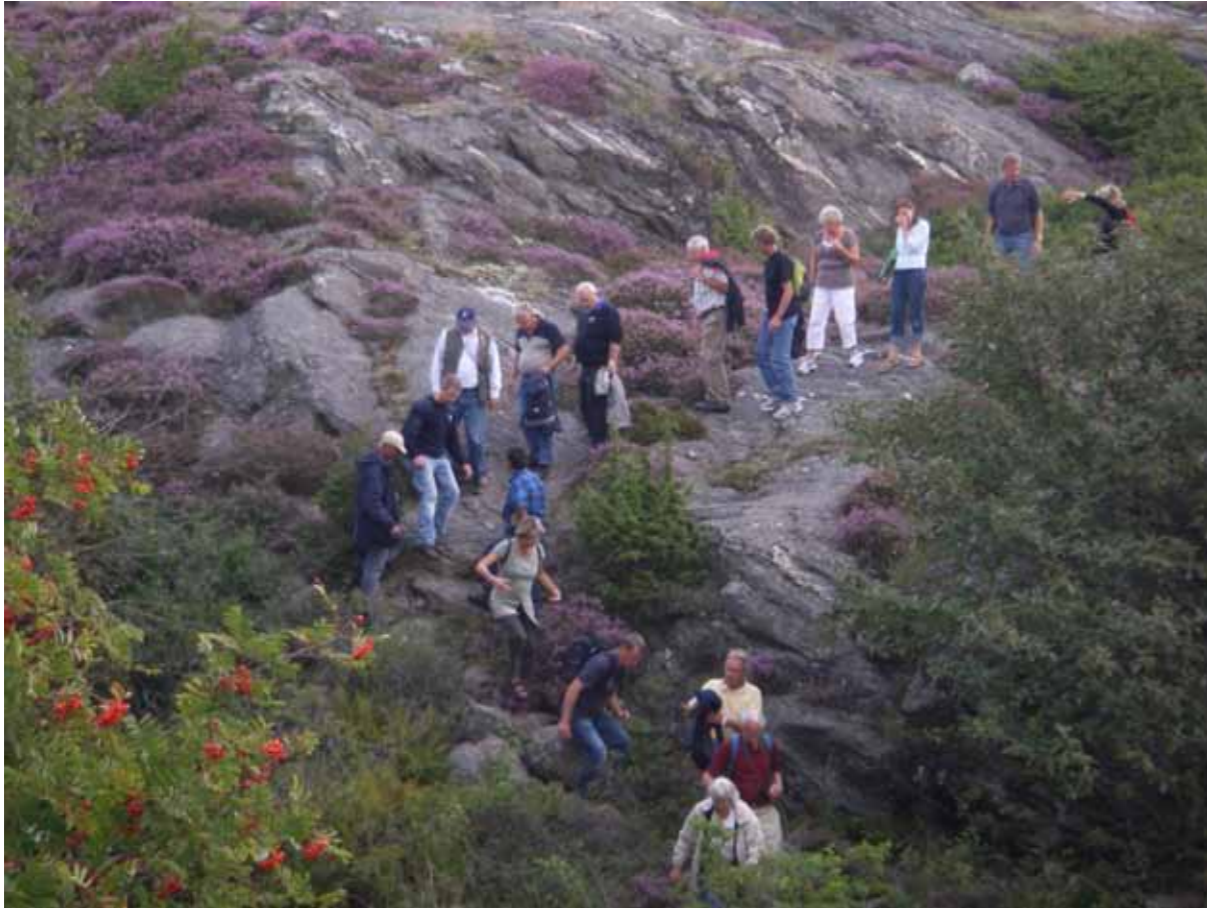
Vandring över Härön