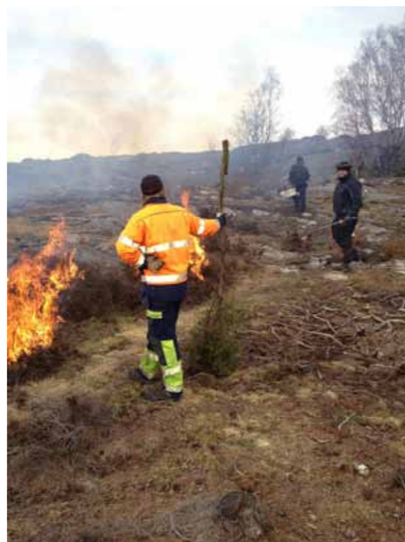
Bränning vid Nordre älvs mynning

Med några års mellanrum bränns ljunghedarna under våren när förutsättningarna är bra. Under året brändes delar av hedarna på Sandsjöbacka, Ramsön, Nordre älvs estuarium, Ryr, Trossö-Kalvö-Lindö, Härmanö, Härön, Åskhult och Älgön.