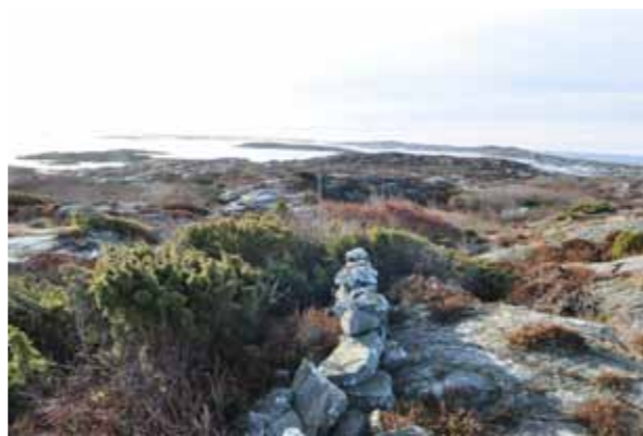
Arbeten för att gynna den biologiska mångfalden kommer att utföras på flera öar under de närmsta åren. Från ovan; Otterön, Härön och Härmanö.