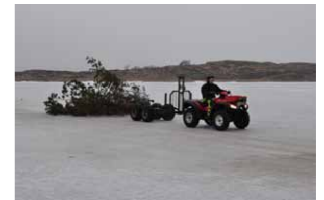
Vintern underlättade arbetet på Hästholmarna

Längst i söder i naturreservatet Nordre älvs estuarium fick projektet en rivstart tack vare den speciella vintern 2010/2011. Kylan hade gjort att isen i fjorden lagt sig redan i december månad. Vår entreprenör Roy Andersson har under några år hjälpt oss med restaureringar på Hisingsidan vid Fåglevik. Tack vare att vi redan var etablerade i området och Roy och hans anställda redan var i full gång med arbete i närheten, så kunde vi utnyttja isen under februari månad. Under några intensiva veckor fällde Roy och hans medarbetare ett stort antal träd och dessa träd kördes iland med fyrhjulingar för att senare flisas upp. Göteborgs Energi såg till att nästan 400 kubikmeter flis från Stora Hästholmen värmdes duschvatten åt göteborgare under en del av juni.