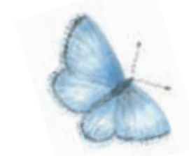
Alkonblåvinge Maculinea alcon