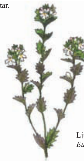
Ljungögontröst Euphrasia micrantha

Mosippan som är mycket sällsynt hittar man numera främst på ljunghedar. Den har läderartade vintergröna blad och gynnas av den ytliga ljungbränning man sedan 1970-talet har utfört på Tånga hed. Den lilla ettåriga ljungögontrösten växer alltid tillsammans med ljung och är svår att upptäcka. Frönas grobarhet är kort och den är mycket konkurrenssvag.