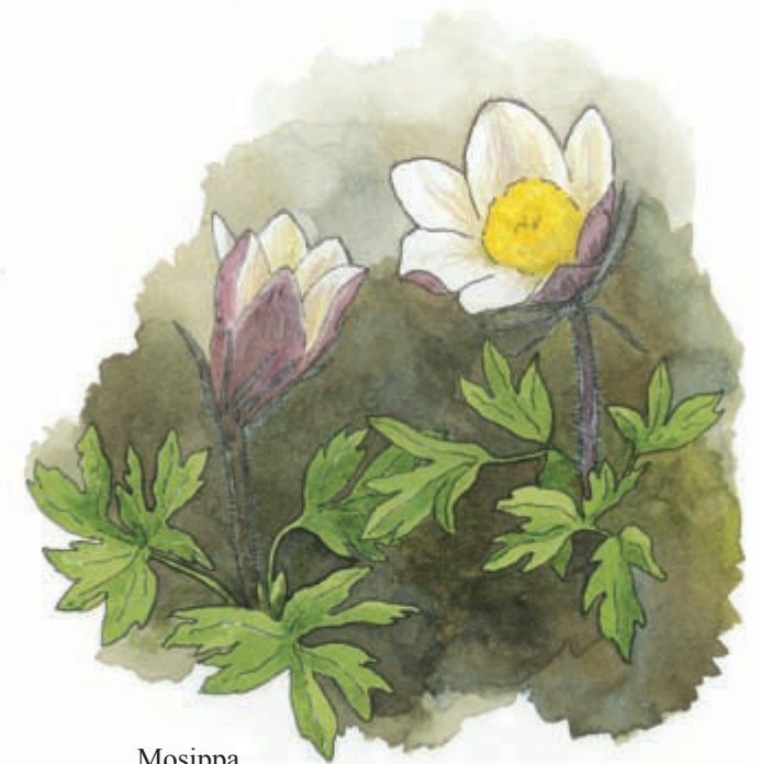
Mosippa Pulsatilla vernalis

Mosippan som är mycket sällsynt hittar man numera främst på ljunghedar. Den har läderartade vintergröna blad och gynnas av den ytliga ljungbränning man sedan 1970-talet har utfört på Tånga hed. Den lilla ettåriga ljungögontrösten växer alltid tillsammans med ljung och är svår att upptäcka. Frönas grobarhet är kort och den är mycket konkurrenssvag.