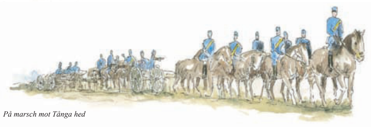
På marsch mot Tånga hed

Text: Ulla Åshede Illustrationer: Kerstin Hagstrand-Velicu 2014