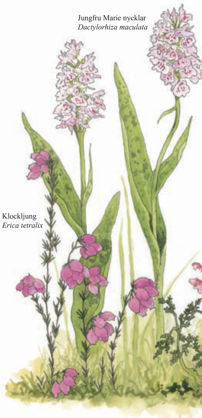
Klockljung Erica tetralix