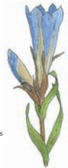
Klockgentiana Gentiana pneumonanthe