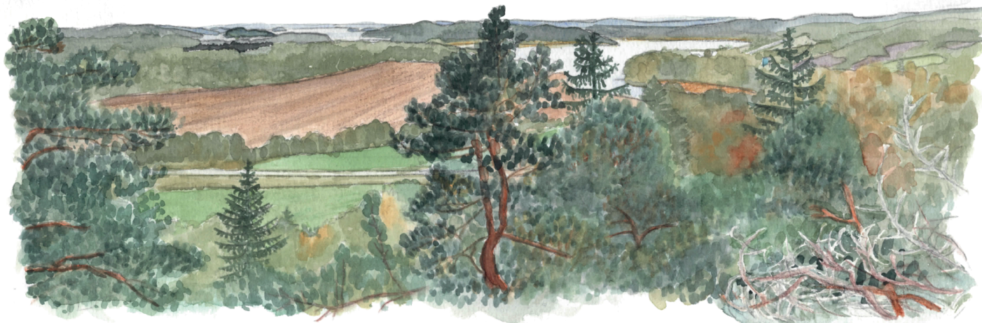
Utsikt mot Mjörn