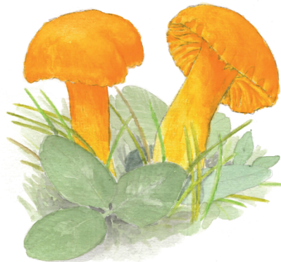
Honungsvaxskivling, Hygrocybe reidii

Reservatet är 17 hektar stort och ägs av Väst kuststiftelsen.