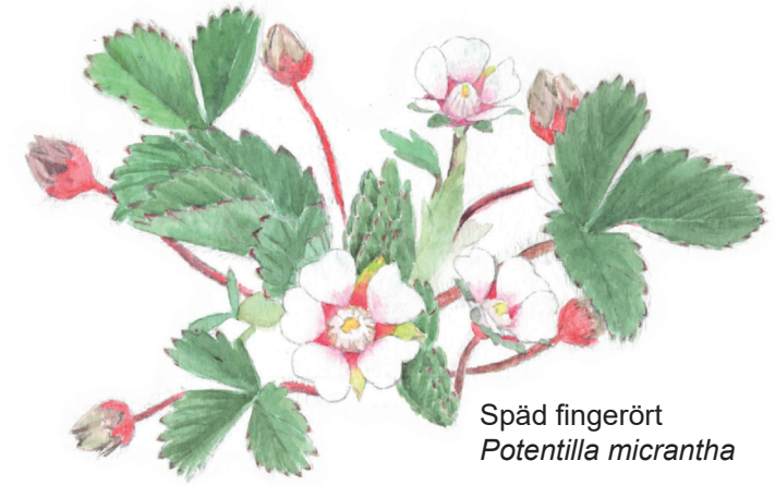
Späd fingerört Potentilla micrantha

De enorma mängderna sand och grus som sprutade genom Brobackasundet avlagrades runt om i de dåtida havsvikarna och kan idag ses på många platser i landskapet. Sydväst om Brobacka ser man resterna av grustäkten Österäng, numera en bergtäkt. Området vid Östads kyrka utgörs av ett mäktigt grusdelta med dödisgropar, flacka grusåsar och blockrika strandtrasser.