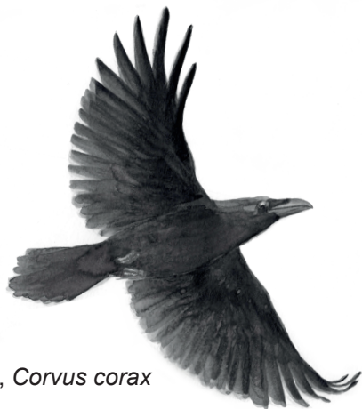
Korp, Corvus corax

There is an exhibition with more information about the reserve in the Soldier's Croft, which is open on Sundays from May to September.