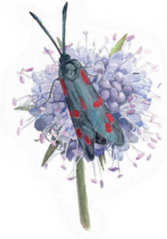
Sexfläckig bastardsvärmare, Zygaena filipendulae , på ängsvädd, Succisa pratensis .