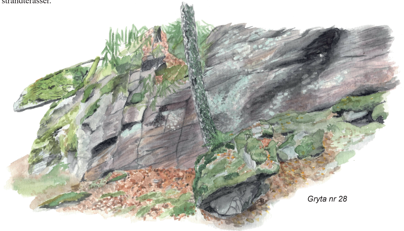
Gryta nr 28