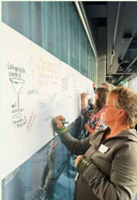
Regional samverkansträff på Scandic Göteborg Central (Platinan).