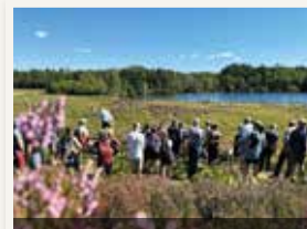
European Heathlands Workshop