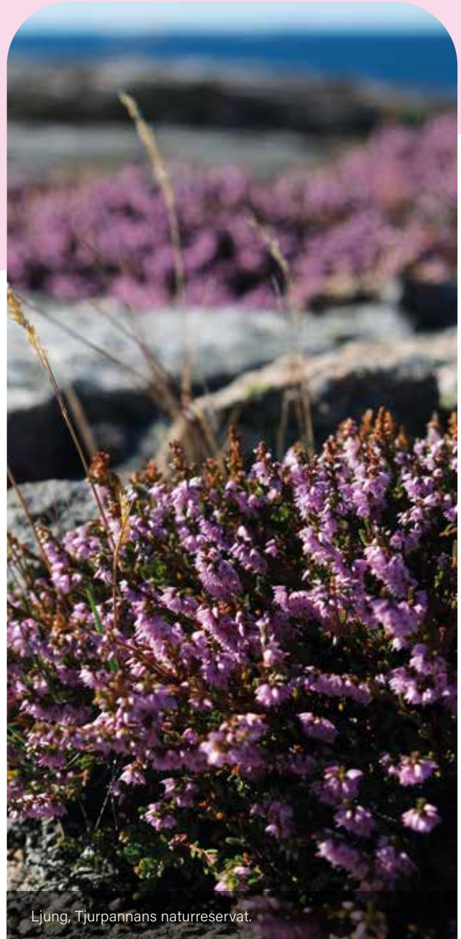
Ljung, Tjurpannans naturreservat.

Dynamiken har format en rik biologisk mångfald med specialiserade och ofta rödlistade arter som klockgentiana, ljungögontröst och alkonblåvinge. I dag återstår bara små fragment av detta hedlandskap som en gång täckte stora delar av södra Sverige. För att kunna återskapa de livsmiljöer som präglar ljunghedens flora och fauna är åtgärder som naturvårdsbränning, bete och restaurering avgörande.