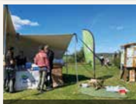
Kungsbacka Outdoor Festival