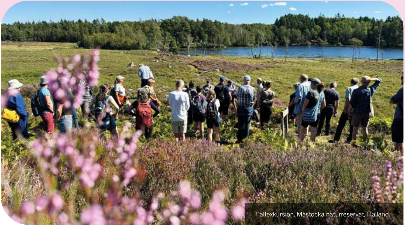
Fälttekursion, Mästocka naturreservat, Halland.