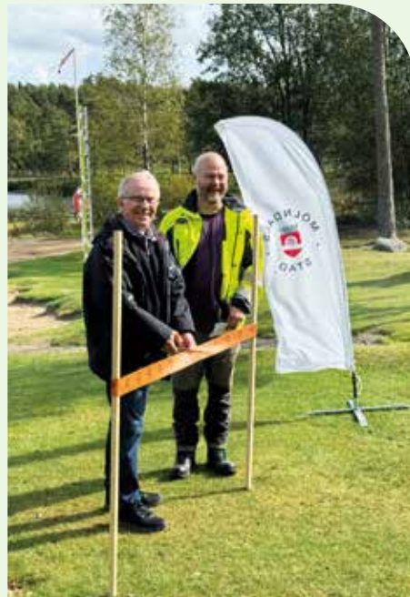
Invigning av Djursjöleden intill Södra Barnsjön utanför Lindome.