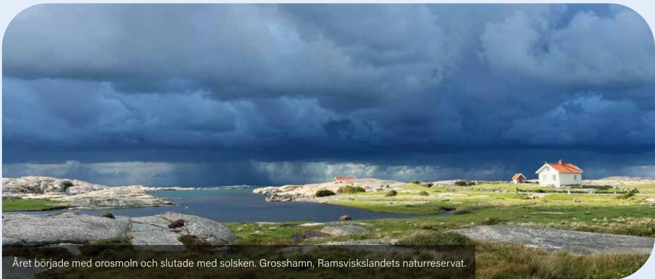
Året började med orosmoln och slutade med solsken. Grosshamn, Ramsviskslandets naturreservat.