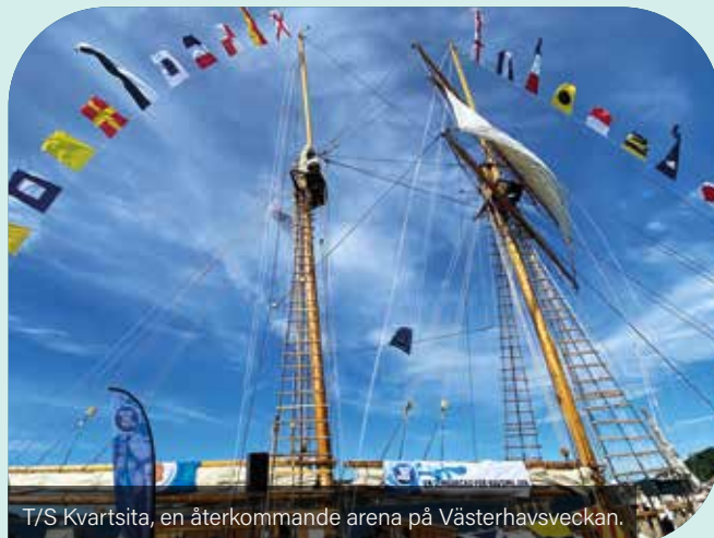
T/S Kvarnsita, en återkommande arena på Västerhavsveckan.

Syftet är att öka havsmedvetenheten hos allmänheten med fokus på biologisk mångfald och klimat. Samtidigt ska veckan bidra till att stärka hållbara marina och maritima näringar, besöksnäring och kreativa näringar.