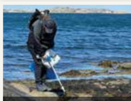
Ploggadagen på Vrångö