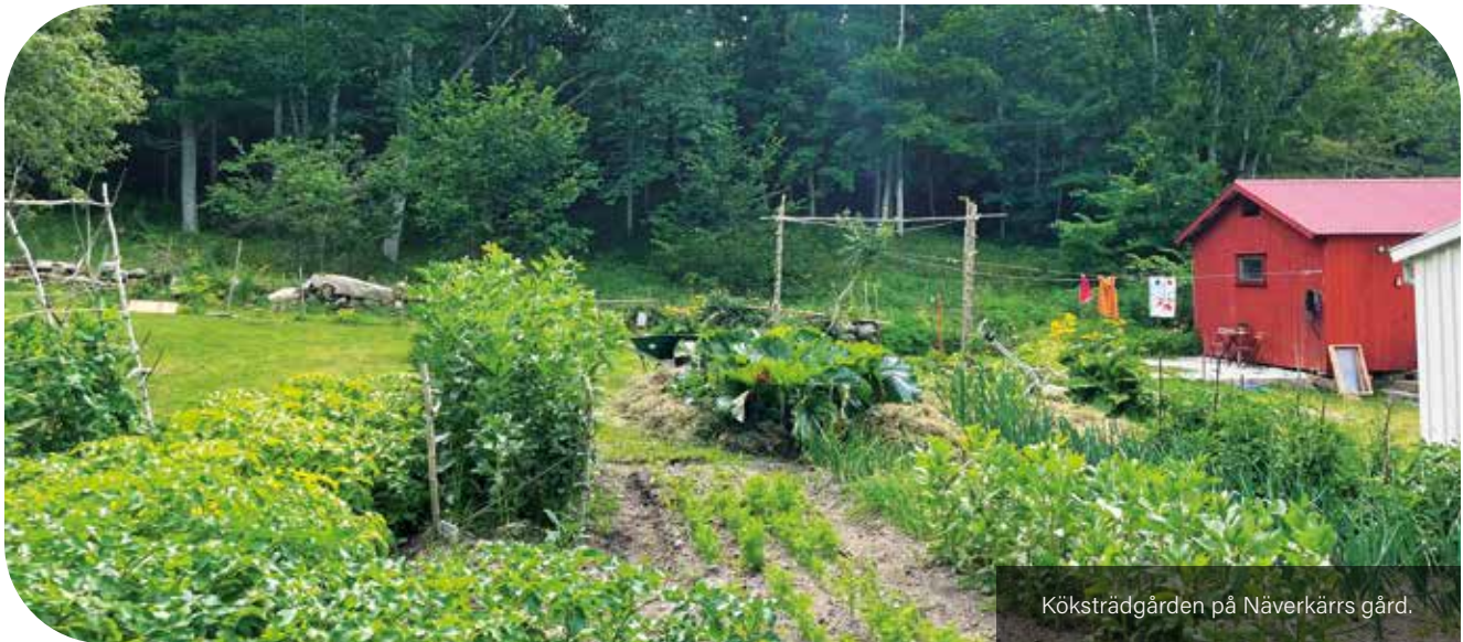
Köksträdgård på Näverkärrs gård.