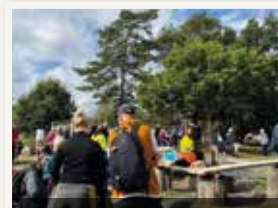
Bohusleden 40 år!