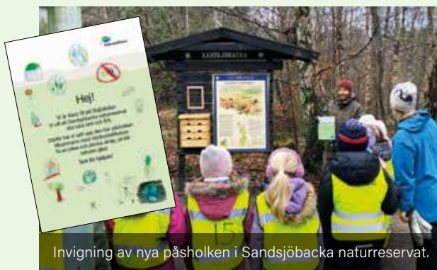
Invigning av nya påsholken i Sandsjöbacka naturreservat.

Under 2025 satte Västkoststiftelsen upp en ny påsholk i Sandsjöbacka naturreservat, nära parkeringen vid Sisjön. Idén kom från elever i årskurs 1B på Sisjöskolan, som efter att ha sett skräp under sina utflykter skickade ett brev till stiftelsen. De föreslog en "brevlåda" med påsar med en uppmaning att ta med skräpet hem.