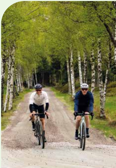
Invigning av Sjuhäradsrundan. På bilden, etapp 1 mellan Borås och Svenljunga.