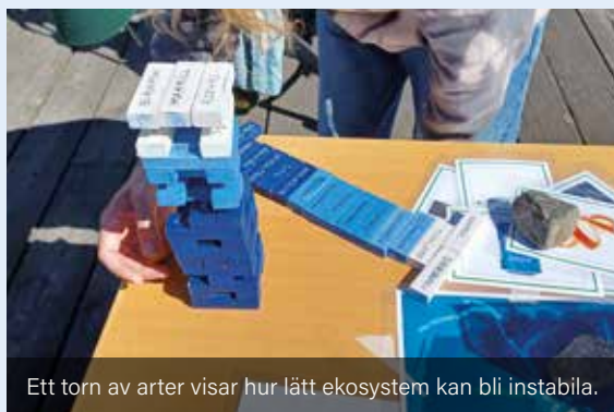
Ett torn av arter visar hur lätt ekosystem kan bli instabila.

Genom lek, kunskap och egna upplevelser i naturen mötte tusentals barn frågor om hav, biologisk mångfald och nedskräpning.