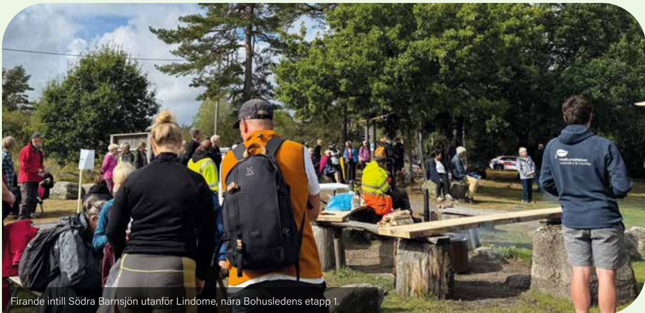
Firande intill Södra Barnsjön utanför Lindome, nära Bohusledens etapp 1.